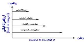
شکل ۹: الگوی حاکم بر زمان CLA (حسینی مقدم، ۱۳۹۰، ص. ۶۹ و ۷۰)