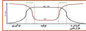
شکل ۸: الگوی حاکم بر زمان مائول کاستلر (حسینی مقدم، ۱۳۹۰، ص. ۶۸)